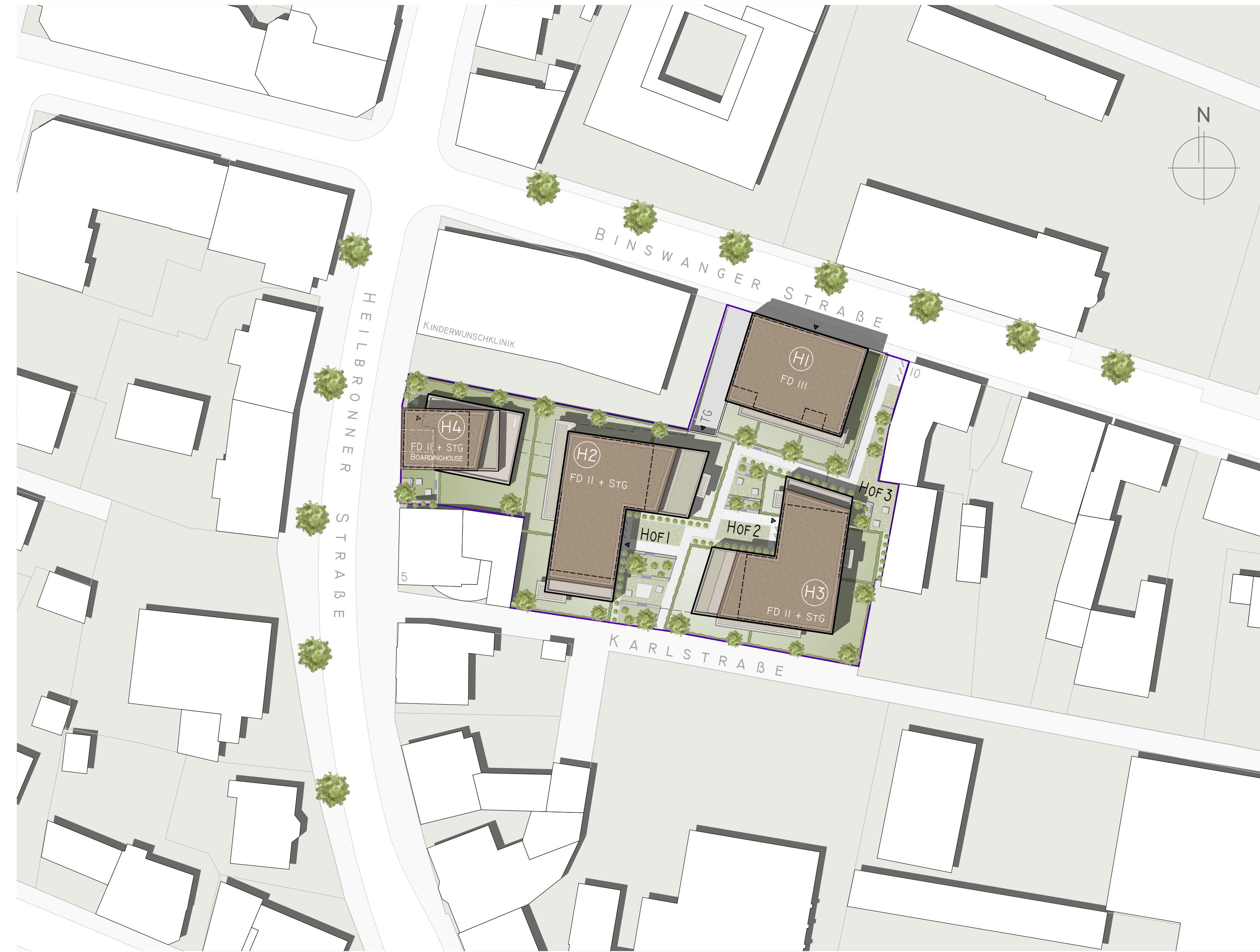
LAGEPLAN M 1:500