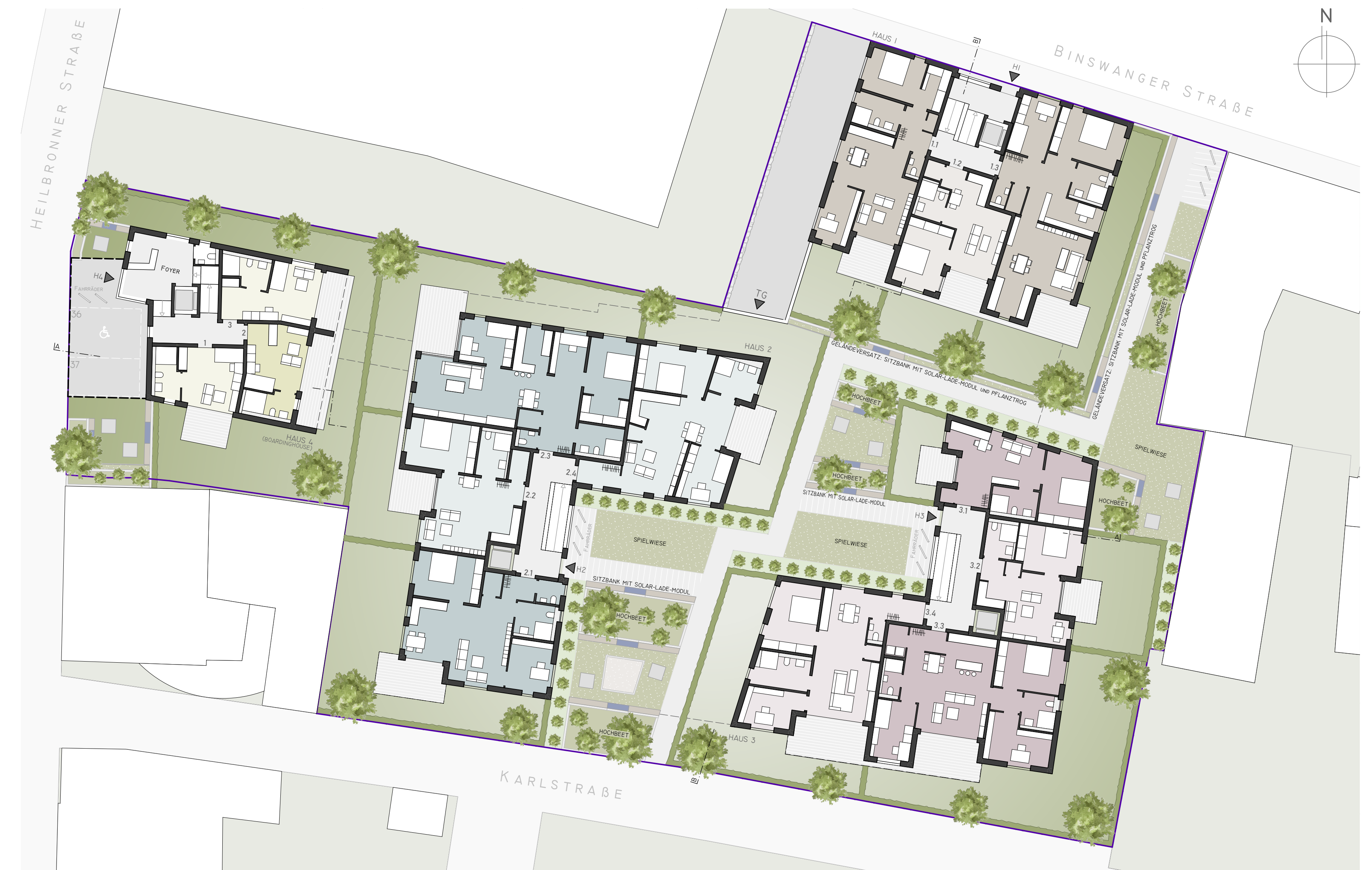
GRUNDRISSE ERDGESCHOSS M 1:200