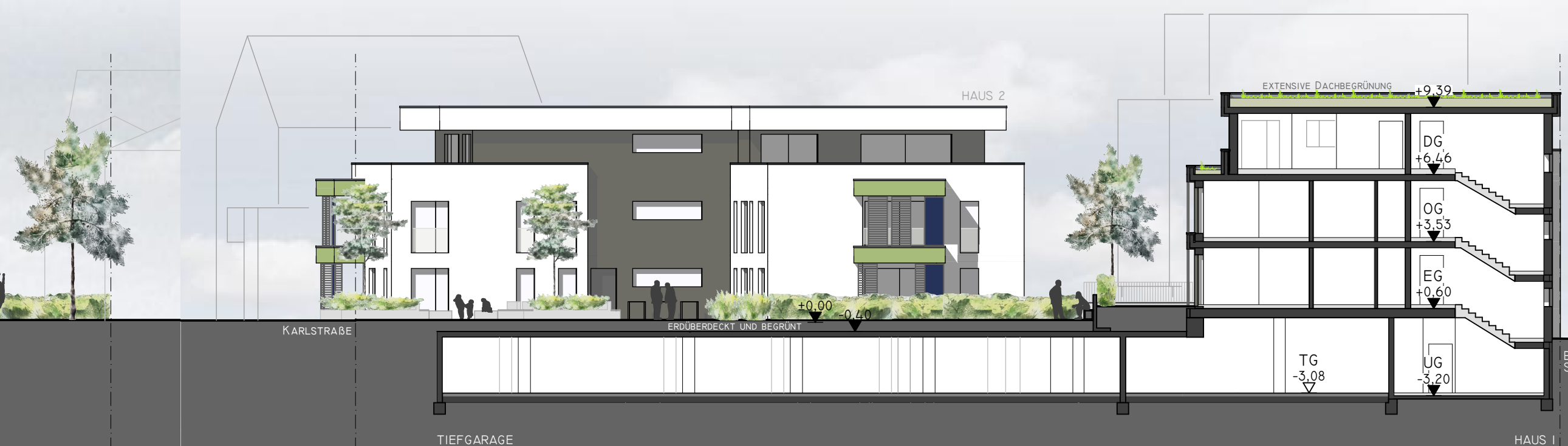
SCHNITT B-B M 1:200