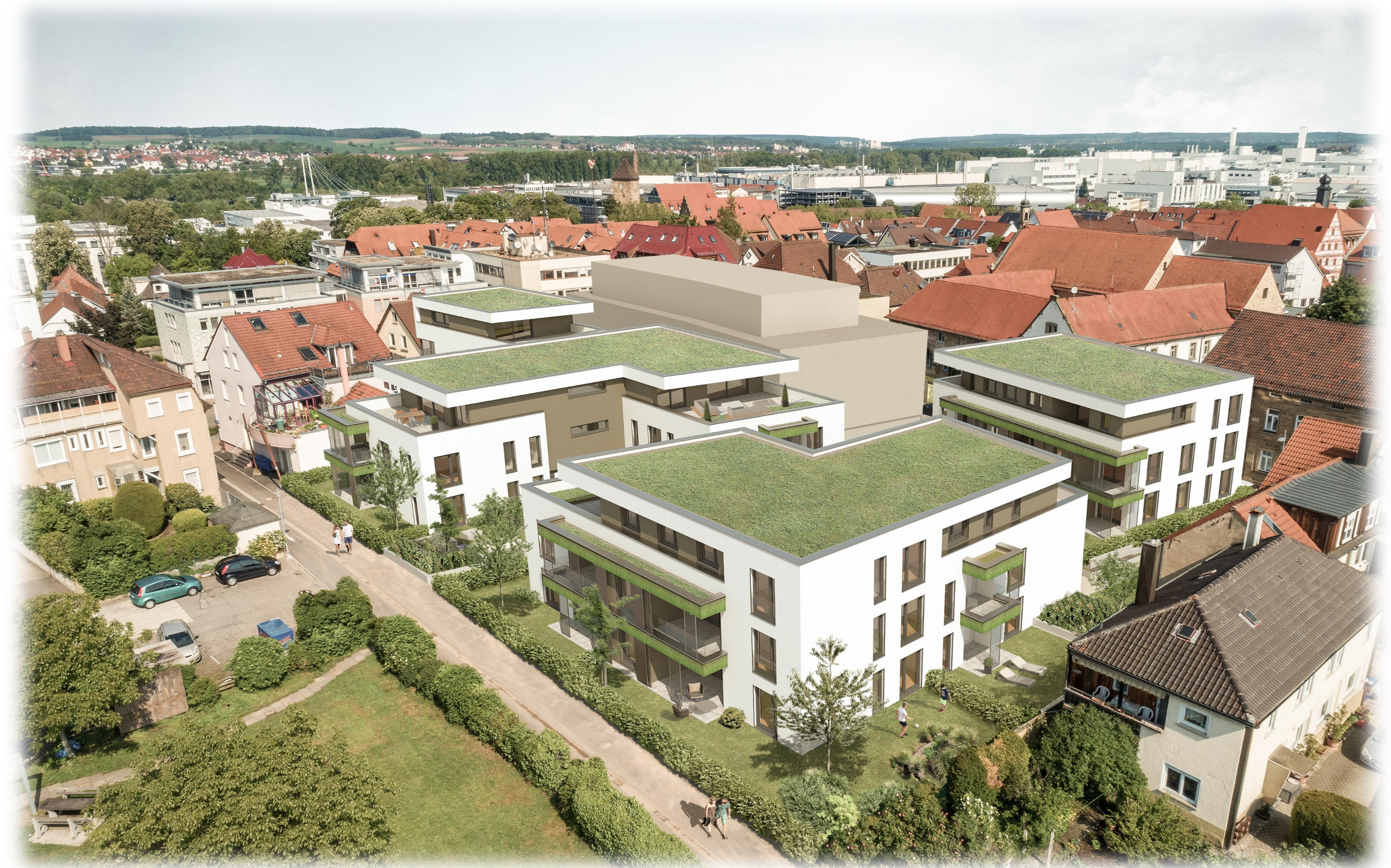
LUFTBILD BLICK AUS SÜD-OST (KARLSTRASSE)