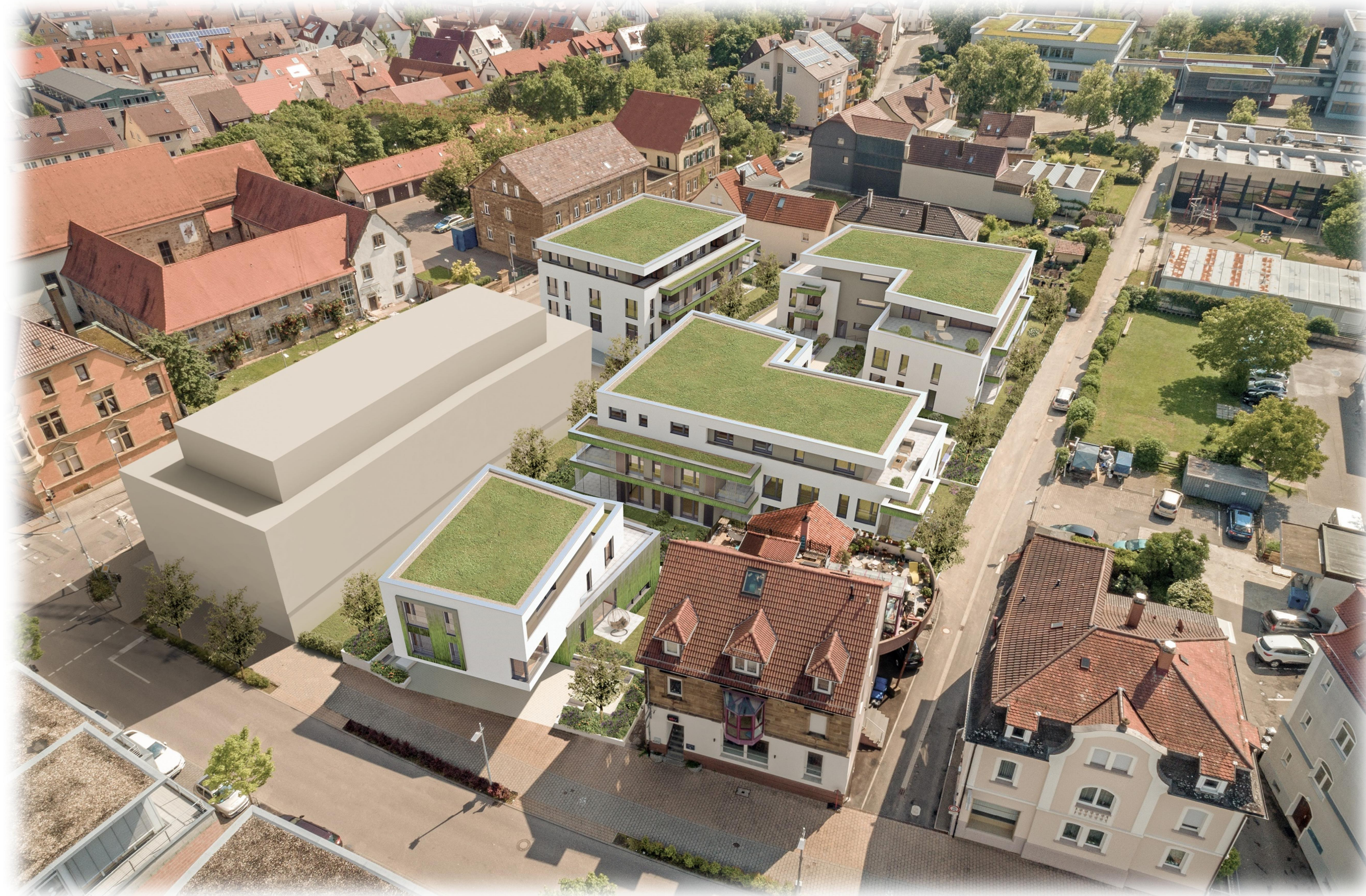
LUFTBILD BLICK AUS SÜD-WEST (HEILBRONNER STRASSE)