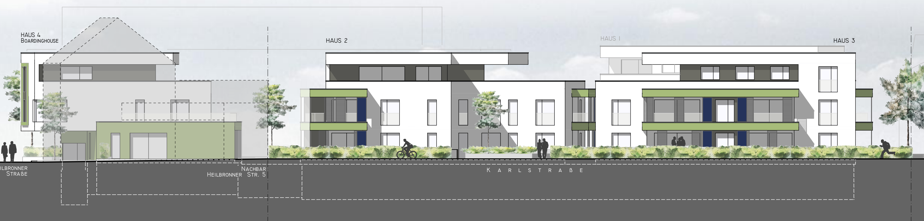
ANSICHT SÜD M 1:200